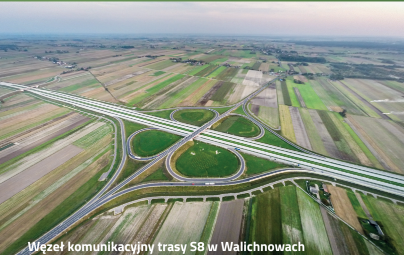
Węzeł komunikacyjny trasy S8 w Walichnowach

Korzystne położenie oraz przebiegająca przez powiat droga ekspresowa S8 Łódź-Wrocław sprawia, że powiat jest dobrze skomunikowany, atrakcyjny turystycznie i gospodarczo.